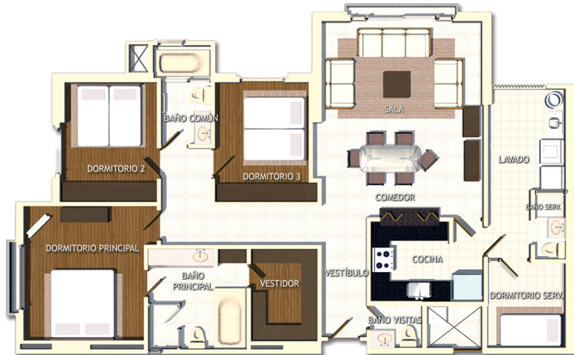
TABLA AREAS APARTAMENTO TIPO B